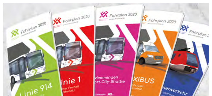
Produktorientiertes Farbsystem: Rot für den Stadtbus, Grün für den Regionalverkehr, Magenta für Sonderverkehr, Orange für den FLEXIBUS, Blau für die Bahn.

Innerhalb des Internetauftritts des VVM ( vvm-online.de ) finden Memminger Fahrgäste unter dem direkten Zugriff über den Domainnamen www.stadtbus-mm.de alle relevanten Informationen zum ÖPNV in der Stadt Memmingen.